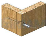
Соединение деталей евровинтами